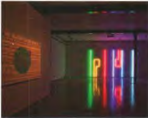
셰자드 다우드 Shezad Dawood

1974년 영국 런던에서 출생했다. 런던 센트럴 세인트 마틴과 영국왕립예술학교에서 수학한 후 리즈 메트로폴리탄 대학에서 박사학위를 받았다. 2006년 런던 아티스트 스튜디오에서 진행된 첫 전시 <Shezad Dawood & Friends>를 포함해 현재까지 25회 이상의 개인전을 개최했으며, 다수의 기획전과 스크리닝에 참여했다. The Abraaj Group Art Prize(2011), Aesthetica Short Film Festival(2015) 등에서 수상했고, 2012년에는 The Jarman Award 최종 후보자 10인에 이름을 올리며 국제적 인지를 공고히 하고 있다.